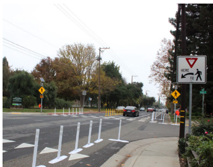
📷 IMPLEMENTACIÓN RÁPIDA (“QUICK-BUILD”) EN SUTTERVILLE ROAD