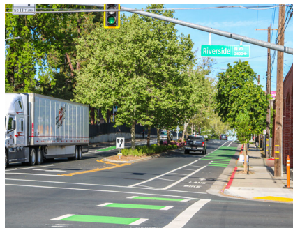
☒ ਬਰੋਡਿਅ ਨਾਲ ਲੈਸ ਸਟਰੀਟ